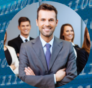
... i wielu innych